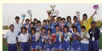
岐阜各務野高校 ホッケー競技 少年女子

全国選抜大会優勝、インターハイ優勝と、弾みをつけて地元・岐阜の国体も優勝したいです。スピードを生かしたプレーで自分たちのホッケーができるよう、チーム一丸となり、毎日の練習を大切にしています。