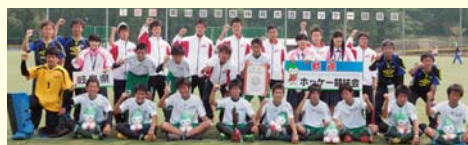
岐阜選抜 ホッケー競技 少年男子

国体2連覇、そしてぎふ清流国体に勢いをつけるためのプレッシャーのかかる大会でしたが、「優勝」することができ、安心しています。