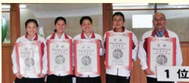
岐阜総合学園高校 弓道競技 少年女子

今回の山口国体では、近的優勝・遠的準優勝という結果を残すことができました。結果を残すまでには苦しいこともありましたが、多くの方に支えていただき乗り越えることができました。ぎふ清流国体でも全力を尽くします。