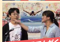
岐阜大学 みそでんがく