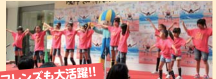
応援フレンズも大活躍!!

今後も「岐阜市ふれ愛ミナモ隊」の訪問先などでどんどん撮影していきますので、ぜひお声をかけていただき、応援写真の撮影に協力してくださいね。