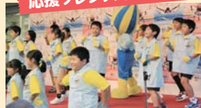
岐阜大学 平成元年