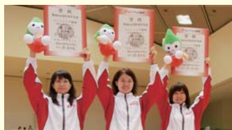
岐阜選抜 フェンシング競技 成年女子 サープル

「日本一」と4年連続の「総合優勝」。私たちは同時に2つの大きな喜びがありました。決勝の相手は開催県である山口県。多くの応援に負けることなく、「強気で前へ」と互いに声をかけ合い日本一を勝ち取りました。ぎふ清流国体も優勝します!!