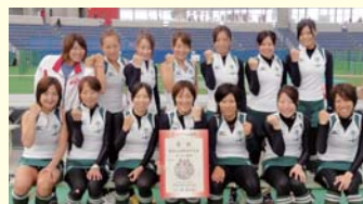
岐阜選抜 ホッケー競技 成年女子

山口国体にて、無失点で優勝し、ぎふ清流国体に向けて連覇で繋げることができ本当にうれしく思います。